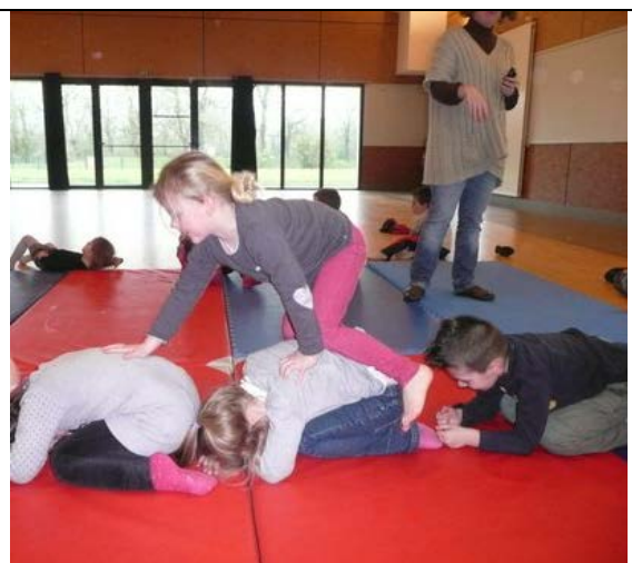
Le jeu des rochers et des promeneurs : il fallait passer par-dessus les rochers.