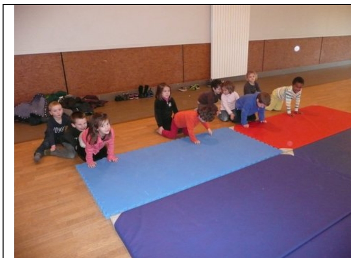
Le jeu de la chenille

Les grands et les moyens ont fait un petit repos dans la salle polyvalente et des jeux sur les tapis :